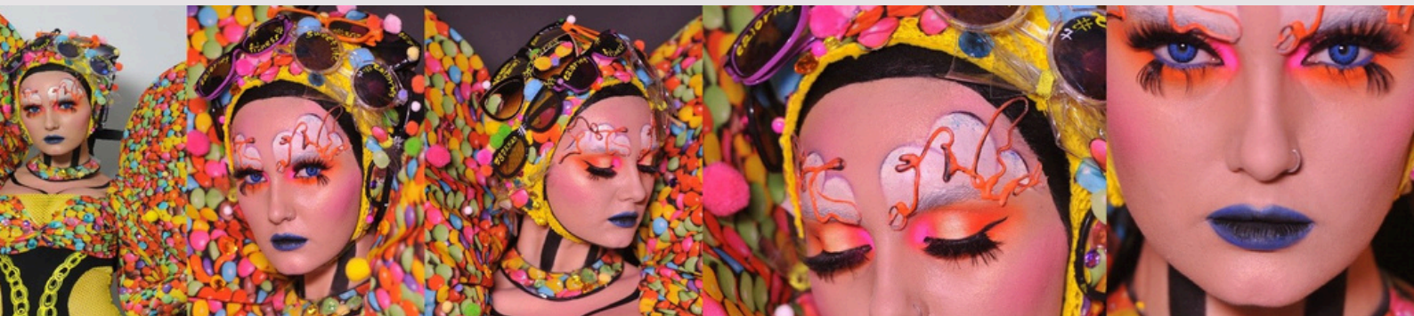
Foto ritratto (1) frontale, (2) con angolazione di 45° dal lato sinistro, (3) con angolazione di 45° dal lato destro. Dettagli: (4) e (5) foto degli occhi, (6) foto delle labbra.