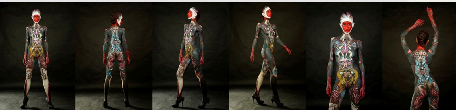
Foto (1) fronte, (2) retro, (3) lato sinistro e (4) lato destro (sempre con l'intero corpo visibile nell'immagine), dettagli del torso: (5) fronte e (6) retro.